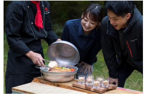
燻製づくり体験イメージ

1日1組限定のプライベート燻製づくり体験です。使用する食材は、ニジマスとキングサーモンを掛け合わせた旨味が強く脂ののった山梨県産ブランド魚「富士の介」や、富士山の伏流水で育った、もっちりとした弾力や甘みが特徴のブランド豚「富士ヶ嶺ポーク」のチャーシューのほか、旬の野菜やチーズを使用。燻製に使用するスモークチップは、サクラ・ブナ・ナラ・リンゴ・クルミからお選びいただけます。それぞれのチップの特徴や食材との相性、素材の旨味を引き出す方法など、料理のプロから直接学ぶことができます。