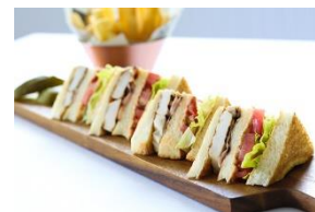
クラシッククラブハウスサンドウィッチイメージ

定番のターキーとベーコン、フレッシュトマトをサクサクにトーストされた 軽い食感のパンでサンドしたクラシッククラブハウスサンドウィッチ。ブラ ンチにも最適なメニューです。