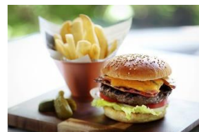
マリオットバーガー イメージ

全世界のマリオットホテル共通レシピで提供されるハンバーガー。ビー フ100%の肉厚のパティにチェダーチーズとクリスピーベーコンなどが 入った食べ応え十分な一品です。